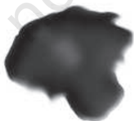
चित्र 5.3 : कोलतार।

यह एक अप्रिय गंध वाला काला गाढ़ा द्रव होता है (चित्र 5.3)। यह लगभग 200 पदार्थों का मिश्रण