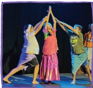
सुरक्षित आश्रय के लिए प्रार्थना

निर्देश — सभी को एक सांकेतिक शब्द दिया गया है और आप अपने समूह में इस बारे में चर्चा करके योजना बना सकते हैं (3 मिनट की अवधि में)।