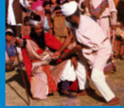
भांड पाथेर, कश्मीर