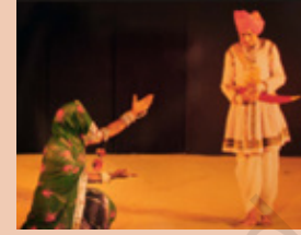
माच, मध्य प्रदेश