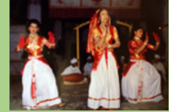
अंकिया नाट, असम