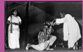
जात्रा, पश्चिम बंगाल