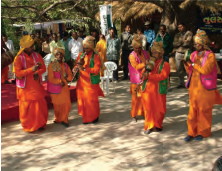
बीन पार्टी के बाजे

को बुरी हालत में रखते हैं। चाहते तो हम भी साँपों को मारकर खूब पैसा कमा सकते थे। तब हमारी ज़िंदगी इतनी मुश्किल भरी न होती। साँपों को मारने की बात तो दूर, ये तो हमारी पूँजी हैं जो हम अपनी आने वाली पीढ़ी को सौंपते हैं। साँपों को तो हम अपनी बेटियों को शादी में तोहफ़े के रूप में भी देते हैं। हमारे कालबेलिया नाच में भी साँप जैसी मुद्राएँ होती हैं।