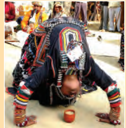
कालबेलिया नाच की एक मुद्रा

आर्यनाथ, तुम्हें अपने लिए अलग तरह की ज़िंदगी सोचनी पड़ेगी। तुम भी अपने पिताजी की तरह बीन बजाने में माहिर हो। तुम अपने साथियों के साथ मिलकर एक बीन पार्टी बनाकर लोगों का मनोरंजन कर सकते हो। पर तुम पीढ़ियों से मिले साँपों के इस ज्ञान को व्यर्थ न गँवाना।