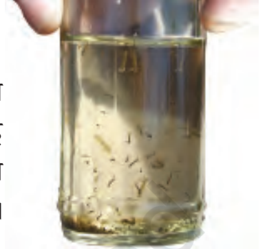
मच्छर के लारवे

रजत – मक्खी तो काटती नहीं है, वह कैसे बीमारी फैलाती होगी?