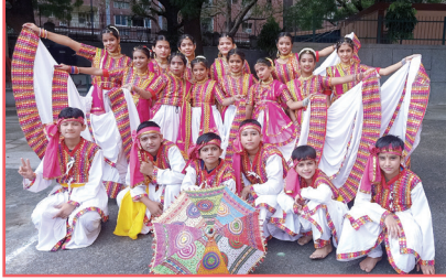
గుజరాత్ కు చెందిన గారా నృత్యం