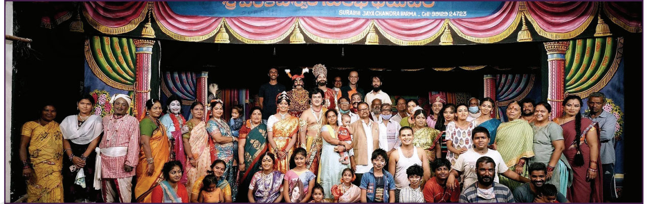
షో తర్వాత కంపెనీ థియేటర్ టీం