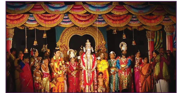
సురభి రంగస్థల నాటకాలు మాయాజాలం, లైవ్ విఎఫ్ఎక్స్ మరియు రంగస్థలంపై లాజిక్ ఫీల్డ్లను ఉపయోగించడంలో ప్రసిద్ధి చెందాయి.

సురభి నాటకశాల లేదా శ్రీ వెంకటేశ్వర నాట్య మండలిని 1885లో ఆంధ్రప్రదేశ్లో స్థాపించారు. దీని మొదటి నాటకం కీచక వధ. ఇది హిందూ సంప్రదాయం మరియు చరిత్ర ఆధారంగా కథలను ప్రదర్శించే కుటుంబ నాటక సంస్థ. 138 సంవత్సరాల నుండి మనుగడ సాగిస్తున్న