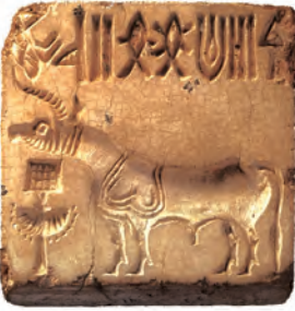
एक हड़प्पाई मुहर

भारत के अतीत की सबसे पहली तसवीर उस सिंधु घाटी सभ्यता में मिलती है, जिसके अवशेष सिंध में मोहनजोदड़ो और पश्चिमी पंजाब में हड़प्पा में मिले हैं। इन खुदाइयों ने प्राचीन इतिहास की समझ में क्रांति ला दी है।