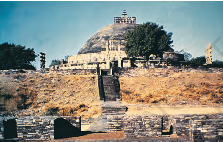
अशोक के समय में निर्मित साँची का स्तूप

इस अद्भुत शासक ने, जिसे आज भी भारत और एशिया के बहुत से दूसरे भागों में प्यार से याद किया जाता है, अपने आपको बुद्ध की शिक्षा के प्रचार में, नेकी और सद्भाव के काम में तथा प्रजा के हित के लिए सार्वजनिक कार्यों के प्रति समर्पित कर दिया। उसने ऐलान कर दिया था कि वह इनके लिए हमेशा तैयार है। हर स्थान पर और हर समय, सरकारी कर्मचारी जनता के कार्यों के बारे में उसे बराबर सूचना देते रहें, चाहे जिस समय और जहाँ भी हो वह लोक-हित के लिए अवश्य काम करेगा।