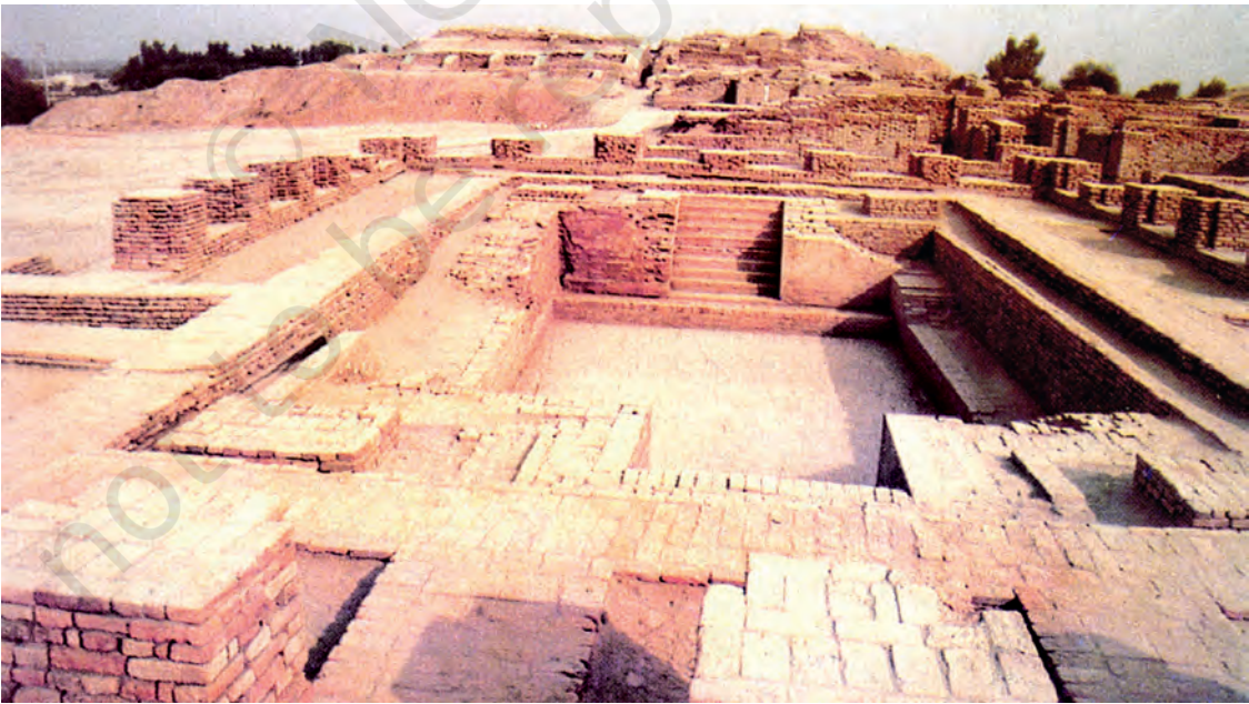
मोहनजोदड़ो का महान स्नानागार

सिंधु घाटी सभ्यता और वर्तमान भारत के बीच समय के ऐसे कई दौर गुज़रे हैं जिनके बारे में हम बहुत कम जानते हैं। वैसे भी इस बीच असंख्य परिवर्तन हुए हैं। लेकिन भीतर ही भीतर निरंतरता की ऐसी शृंखला चली आ रही है जो आधुनिक भारत को छः-सात हज़ार पुराने उस बीते हुए युग से जोड़ती है जब संभवतः सिंधु घाटी सभ्यता की शुरुआत हुई थी। यह देखकर अचरज होता है कि मोहनजोदड़ो और हड़प्पा में कितना कुछ ऐसा है जो हमें