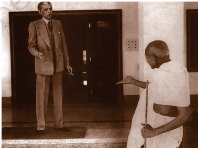
जिन्ना और गांधी

जिसे सांप्रदायिक समस्या कहा जाता था, वह अल्पसंख्यकों के अधिकारों के साथ इस तरह तालमेल बैठाना था ताकि उन्हें बहुसंख्यकों के खिलाफ़ पर्याप्त संरक्षण मिल सके। भारत के अल्पसंख्यक यूरोप की तरह जातीय या राष्ट्रीय अल्पसंख्यक नहीं, वे धार्मिक अल्पसंख्यक हैं। जातीय दृष्टि से भारत में एक विचित्र मिश्रण है, पर जातीय सवाल भारत में न कभी उठे हैं न उठ सकते हैं। धर्म इन जातीय विभिन्नताओं के ऊपर है। जातियाँ या तो एक दूसरे में मिल जाती हैं या उनमें अंतर करना कठिन होता है। ज़ाहिर है कि धार्मिक दीवारें स्थायी नहीं होतीं और जो व्यक्ति अपना धर्म बदलता है उसकी जातीय पृष्ठभूमि या उसकी जातीय और भाषिक विरासत नष्ट नहीं हो जाती। परंतु राजनीतिक मामलों में, धर्म का स्थान सांप्रदायिकता ने ले लिया है। यह एक संकीर्ण समुदाय