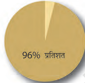
जनता के बीच आकाशवाणी का दायरा

आज टेलीविजन जनसंचार का सबसे लोकप्रिय और ताकतवर माध्यम बन गया है। प्रिंट मीडिया के शब्द और रेडियो की ध्वनियों के साथ जब टेलीविजन के दृश्य मिल जाते हैं तो सूचना