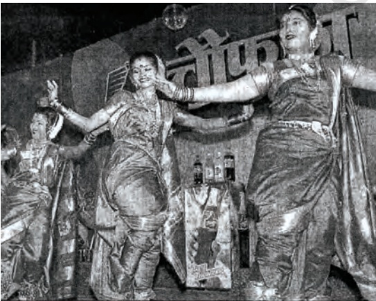
महाराष्ट्र का लावनी नृत्य

जनभावनाओं को राजदरबार तक पहुँचाने और राजा का संदेश जनता के बीच प्रसारित करने की समृद्ध व्यवस्थाओं के उदाहरण बाद में भी दिखाई पड़ते हैं। चंद्रगुप्त मौर्य, अशोक जैसे सम्राटों के शासन-काल में स्थायी महत्त्व के संदेशों के लिए शिलालेखों और सामयिक या तात्कालिक संदेशों के लिए कच्ची स्याही या रंगों से संदेश लिखकर प्रदर्शित करने की व्यवस्था और मजबूत हुई। तब बाकायदा रोज़नामचा लिखने के लिए कर्मचारी नियुक्त किए जाने लगे और जनता के बीच संदेश भेजने के लिए भी सही व्यवस्था की गई।