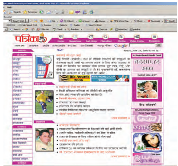
इंटरनेट पर पत्रिकाएँ

यह एक अंतरक्रियात्मक माध्यम है यानी आप इसमें मूक दर्शक नहीं हैं। आप सवाल-जवाब, बहस-मुबाहिषों में भाग