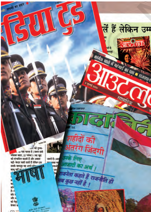
वर्तमान की कुछ प्रमुख पत्रिकाएँ

जहाँ बाहर से खबरें लाने का काम संवाददाताओं का होता है, वहीं तमाम खबरों, लेखों, फ़ीचरों को व्यवस्थित तरीके से संपादित करने और सुरुचिपूर्ण ढंग से छापने का काम संपादकीय विभाग में काम करनेवाले संपादकों का होता है। आज पत्रकारिता का क्षेत्र भी बहुत व्यापक हो चला है। खबर का संबंध किसी एक या दो विषयों से नहीं होता। दुनिया के किसी भी कोने की घटना समाचार बन सकती है बशर्ते कि उसमें पाठकों की दिलचस्पी हो या उसमें सार्वजनिक हित निहित हो। हालाँकि दुनिया में अखबारी पत्रकारिता को अस्तित्व में आए 400 साल हो गए हैं, लेकिन भारत में इसकी शुरुआत सन् 1780 में जेम्स ऑगस्ट हिकी के 'बंगाल गज़ट' से हुई जो कलकत्ता (कोलकाता) से निकला था जबकि हिंदी का पहला साप्ताहिक पत्र 'उदंत मार्टड' भी कलकत्ता से ही सन् 1826 में पंडित जुगल किशोर शुक्ल के संपादन में निकला था। हिंदी