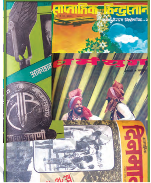
अतीत की कुछ प्रमुख पत्रिकाएँ

जनसंचार की सबसे मज़बूत कड़ी पत्र-पत्रिकाएँ या प्रिंट मीडिया ही है। हालाँकि अपने विशाल दर्शक वर्ग और तीव्रता के कारण रेडियो और टेलीविज़न की ताकत ज़्यादा मानी जा सकती है लेकिन वाणी को शब्दों के रूप में रिकार्ड करने वाला आरंभिक माध्यम होने की वजह से प्रिंट मीडिया का महत्त्व हमेशा बना रहेगा। आज भले ही प्रिंट, रेडियो, टेलीविज़न या इंटरनेट, किसी भी माध्यम से खबरों के संचार को पत्रकारिता कहा जाता हो, लेकिन आरंभ में केवल प्रिंट माध्यमों के ज़रिये खबरों के आदान-प्रदान को ही पत्रकारिता कहा जाता था। इसके तीन पहलू हैं—पहला समाचारों को संकलित करना, दूसरा उन्हें संपादित कर छपने लायक बनाना और तीसरा पत्र या पत्रिका के रूप में छापकर पाठक तक पहुँचाना। हालाँकि तीनों ही काम आपस में गहरे जुड़े हैं लेकिन पत्रकारिता के तहत हम पहले दो कामों को ही लेते हैं क्योंकि प्रकाशन और वितरण का कार्य तकनीकी और प्रबंधकीय विभागों के अधीन होते हैं जबकि रिपोर्टिंग और संपादन के काम के लिए एक विशेष बौद्धिक और पत्रकारीय कौशल की अपेक्षा होती है।