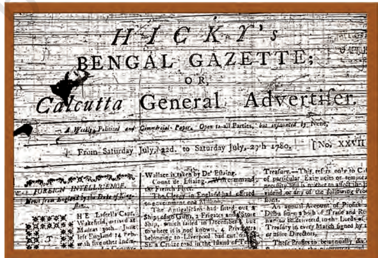
1780 में प्रकाशित होने वाला भारत का पहला अखबार

लेकिन जहाँ आज़ादी से पहले पत्रकारिता का लक्ष्य स्वाधीनता की प्राप्ति था, वहीं आज़ादी के बाद पत्रकारिता का लक्ष्य बदलने लगा। शुरुआती दो दशकों तक पत्रकारिता राष्ट्र-निर्माण के प्रति प्रतिबद्ध दिखती थी। लेकिन उसके बाद उसका चरित्र व्यावसायिक और प्रोफ़ेशनल होने लगा। यही कारण है कि कुछ लोग कहते हैं कि आज़ादी से पहले पत्रकारिता एक मिशन थी लेकिन आज़ादी के