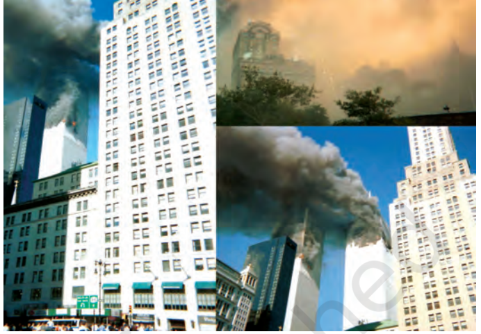
वर्ल्ड ट्रेड सेंटर पर आतंकवादी हमला

दुनिया के किसी भी कोने में कोई घटना हो, जनसंचार माध्यमों के जरिये कुछ ही मिनटों में हमें खबर मिल जाती है। अगर वहाँ किसी टेलीविजन समाचार चैनल का संवाददाता मौजूद हो तो हमें वहाँ की तस्वीरों भी तुरंत देखने को मिल जाती हैं। याद कीजिए 11 सितंबर 2001 को अमेरिका में वर्ल्ड ट्रेड सेंटर पर आतंकवादी हमले को पूरी दुनिया ने अपनी आँखों के सामने घटते देखा। इसी तरह आज टेलीविजन के परदे पर हम दुनियाभर के अलग-अलग क्षेत्रों में घट रही घटनाओं को सीधे प्रसारण के जरिये ठीक उसी समय देख सकते हैं। आप क्रिकेट मैच देखने स्टेडियम भले न जाएँ लेकिन आप घर बैठे उस मैच का सीधा प्रसारण ( लाइव ) देख सकते हैं।