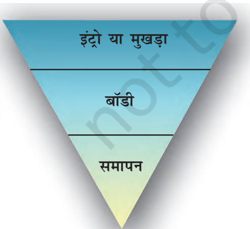
उलटा पिरामिड में समाचार का ढाँचा