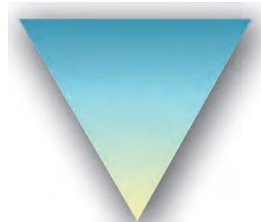
उलटा पिरामिड-समाचार लेखन शैली