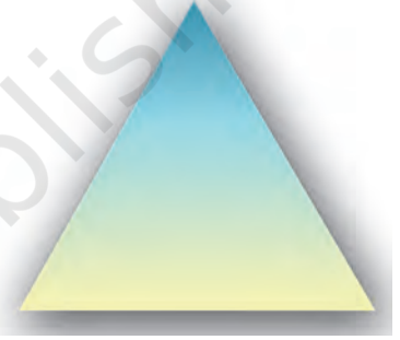
सीधा पिरामिड-कथात्मक लेखन

(इंवर्टेड पिरामिड स्टाइल) के नाम से जाना जाता है। यह समाचार लेखन की सबसे लोकप्रिय, उपयोगी और बुनियादी शैली है। यह शैली कहानी या कथा लेखन की शैली के ठीक उलटी है जिसमें क्लाइमेक्स बिलकुल आखिर में आता है। इसे उलटा पिरामिड इसलिए कहा जाता