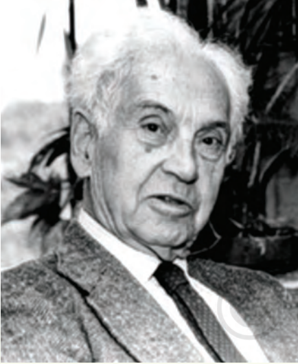
एरनस्ट मेयर (1904 - 2005)

एरनस्ट मेयर का जन्म 5 जुलाई, 1904 में केंपटन, जर्मनी में हुआ था। आप हावर्ड विश्वविद्यालय के विकासपरक जीव वैज्ञानिक थे, जिन्हें '20वीं शती का डार्विन' कहा गया। आप अब तक के 100 महान वैज्ञानिकों में से एक थे। मेयर ने सन् 1953 में हावर्ड विश्वविद्यालय की कला एवं विज्ञान संकाय में नौकरी प्राप्त की और 1975 में एलेक्जेंडर अगासीज प्रोफ़ेसर ऑफ़ जुलोजी एमीरिटस की पदवी के साथ अवकाश प्राप्त किया। अपने 80 सालों के कार्य जीवन में आपका पक्षी-विज्ञान, वर्गीकरण-विज्ञान, प्राणि-भूगोल, विकास, वर्गिकी तथा जीव विज्ञान के इतिहास एवं दर्शन आदि पर अनुसंधान केंद्रित रहा। आप ने लगभग अकेले ही विकासीय जीव विज्ञान के केंद्रीय प्रश्न जाति विविधता की उत्पत्ति को खड़ा किया, जो कि आज सच है। इसके साथ ही आपने हाल ही में स्वीकृत जीव वैज्ञानिक जाति वर्गिकी की परिभाषा की अगुवाई की। मेयर को तीन पुरस्कार दिए गए, जिन्हें व्यापक तौर पर जीव विज्ञान के तीन ताजों की संज्ञा दी जाती है: 1983 में बालजॉन प्राइज, 1998 में जीव विज्ञान के लिए इंटरनेशनल प्राइज और 1999 में क्राफ़र्ड प्राइज। मेयर 100 वर्ष की आयु में 2005 में स्वर्गवासी हुए।