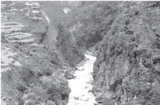
चित्र 2.1 : गॉर्ज

कठोर एवं स्थिर प्रायद्वीपीय खंड के विपरीत हिमालय और अतिरिक्त-प्रायद्वीपीय पर्वतमालाओं की भूवैज्ञानिक संरचना तरुण, दुर्बल और लचीली है। ये पर्वत वर्तमान समय में भी बहिर्जनिक तथा अंतर्जनित बलों की अंतर्क्रियाओं से प्रभावित हैं। इसके परिणामस्वरूप इनमें वलन, भ्रंश और क्षेप (thrust) बनते हैं। इन पर्वतों की उत्पत्ति विवर्तनिक हलचलों से जुड़ी है। तेज बहाव वाली नदियों से अपरदित ये पर्वत अभी भी युवा अवस्था में हैं। गॉर्ज, V-आकार घाटियाँ, क्षिप्रिकाएँ व जल-प्रपात इत्यादि इसका प्रमाण हैं।