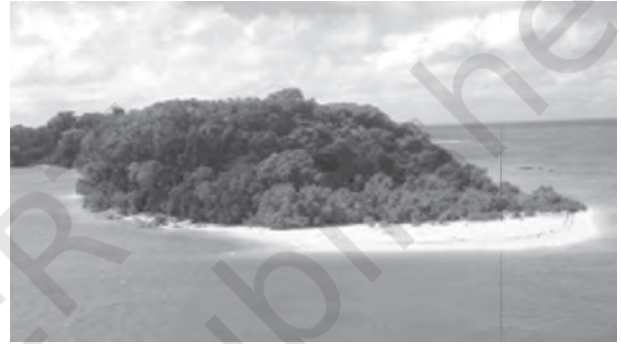
चित्र 2.8 : एक द्वीप

किलोमीटर से 480 किलोमीटर दूर स्थित है। पूरा द्वीप समूह प्रवाल निक्षेप से बना है। यहाँ 36 द्वीप हैं और इनमें से 11 पर मानव आवास है। मिनिक्ॉय सबसे बड़ा द्वीप है जिसका क्षेत्रफल 453 वर्ग किलोमीटर है। पूरा द्वीप समूह 10 डिग्री चैनल द्वारा दो भागों में बाँटा गया है, उत्तर में अमीनी द्वीप और दक्षिण में कनानोरे द्वीप। इस द्वीप समूह पर तूफ़ान निर्मित पुलिन हैं जिस पर अबद्ध गुटिकाएँ, शिंगिल, गोलाशिमकाएँ तथा गोलाशम पूर्वी समुद्र तट पर पाए जाते हैं।