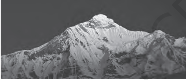
चित्र 2.3 : हिमालय

उत्तरी-पूर्वी पहाड़ियाँ शामिल हैं। हिमालय में कई समानांतर पर्वत शृंखलाएँ हैं। इसमें बृहत हिमालय, पार हिमालय शृंखलाएँ, मध्य हिमालय और शिवालिक प्रमुख श्रेणियाँ हैं। भारत के उत्तरी-पश्चिमी भाग में हिमालय की ये श्रेणियाँ उत्तर-पश्चिम दिशा से दक्षिण-पूर्व दिशा की ओर फैली हैं। दार्जिलिंग और सिक्किम क्षेत्रों में ये श्रेणियाँ पूर्व-पश्चिम दिशा में फैली हैं जबकि अरुणाचल प्रदेश में ये दक्षिण-पश्चिम से उत्तर-पश्चिम की ओर घूम जाती हैं। मिजोरम, नागालैंड और मणिपुर में ये पहाड़ियाँ उत्तर-दक्षिण दिशा में फैली हैं। बृहत हिमालय शृंखला, जिसे केंद्रीय अक्षीय श्रेणी भी कहा जाता है, की पूर्व-पश्चिम लंबाई लगभग 2,500 किलोमीटर तथा उत्तर से दक्षिण इसकी चौड़ाई 160 से 400 किलोमीटर है। जैसाकि मानचित्र से स्पष्ट है हिमालय, भारतीय उपमहाद्वीप तथा मध्य एवं पूर्वी एशिया के देशों के बीच एक मजबूत लंबी दीवार के रूप में खड़ा है। क्या आप भारतीय उपमहाद्वीप के देशों के नाम बता सकते हैं?