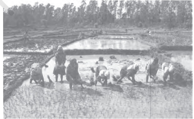
चित्र 2.4 : उत्तरी मैदान

तराई से दक्षिण में मैदान है जो पुराने और नए जलोढ़ से बना होने के कारण बाँगर और खादर कहलाता है। इस मैदान में नदी की प्रौढ़ावस्था में बनने वाली अपरदनी और निक्षेपण स्थलाकृतियाँ, जैसे- बालू-रोधिका, विसर्प, गोखुर झीलें और गुंफित नदियाँ पाई जाती हैं। ब्रह्मपुत्र घाटी का मैदान नदीय द्वीप और बालू-रोधिकाओं की उपस्थिति के लिए जाना जाता है। यहाँ ज़्यादातर क्षेत्र में समय-समय पर बाढ़ आती रहती है और नदियाँ अपना रास्ता बदल कर गुंफित वाहिकाएँ बनाती रहती हैं।