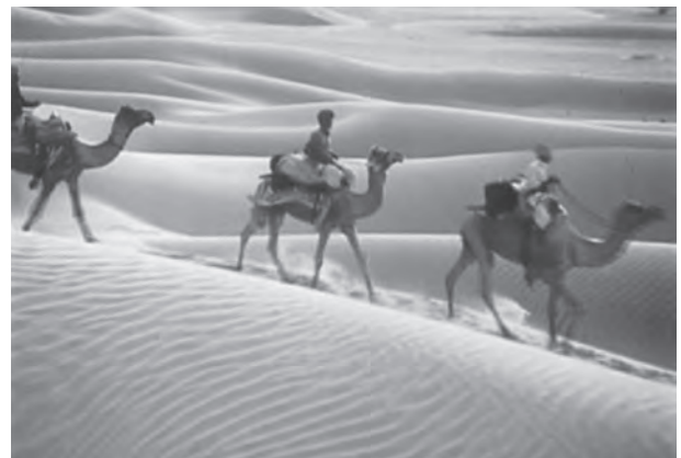
चित्र 2.6 : भारतीय मरुस्थल

विशाल भारतीय मरुस्थल अरावली पहाड़ियों से उत्तर-पूर्व में स्थित है। यह एक ऊबड़-खाबड़ भूतल है जिस पर बहुत से अनुदैर्घ्य रेतीले टीले और बरखान पाए जाते हैं। यहाँ पर वार्षिक वर्षा 150 मिलीमीटर से कम होती है और परिणामस्वरूप यह एक शुष्क और वनस्पति रहित क्षेत्र है। इन्ही स्थलाकृतिक गुणों के कारण इसे 'मरुस्थली' के नाम से जाना जाता है। यह माना जाता है कि मेसोजोइक काल में यह क्षेत्र समुद्र का हिस्सा था। इसकी पुष्टि आकल में स्थित काष्ठ जीवाश्म पार्क में उपलब्ध प्रमाणों तथा जैसलमेर के निकट ब्रह्मसर के आस-पास के समुद्री निक्षेपों से होती है (काष्ठ जीवाश्म की आयु लगभग 18 करोड़ वर्ष आँकी गई है)। यद्यपि इस क्षेत्र की भूगर्भीय चट्टान संरचना प्रायद्वीपीय पठार का विस्तार है, तथापि अत्यंत शुष्क दशाओं के कारण इसकी धरातलीय आकृतियाँ