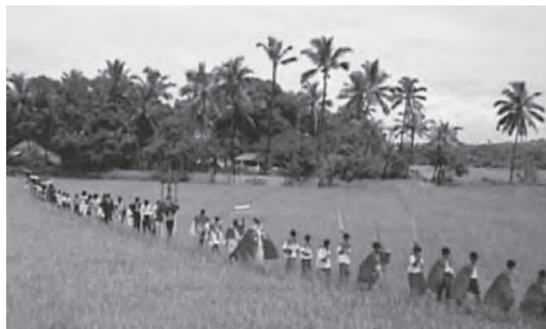
चित्र 2.7 : तटीय मैदान

पश्चिमी तटीय मैदान जलमग्न तटीय मैदानों के उदाहरण हैं। ऐसा विश्वास है कि पौराणिक शहर द्वारका, जो किसी समय पश्चिमी तट पर मुख्य भूमि पर स्थित था, अब पानी में डूबा हुआ है। जलमग्न होने के कारण पश्चिमी तटीय मैदान एक संकीर्ण पट्टी मात्र है और पत्तनों एवं बंदरगाह विकास के लिए प्राकृतिक परिस्थितियाँ प्रदान करता है। यहाँ पर स्थित प्राकृतिक बंदरगाहों में कांडला, मजगाँव, जे एल एन नावहा शेवा, मर्गागाओ, मैंगलौर, कोचीन शामिल हैं। उत्तर में गुजरात तट से, दक्षिण में केरल तट तक फैले पश्चिमी तटीय मैदान को निम्नलिखित भागों में विभाजित किया जा सकता है गुजरात का कच्छ और काठियावाड़ तट, महाराष्ट्र का कोंकण तट और गोवा तट, कर्नाटक तथा केरल के क्रमशः मालाबार तट। पश्चिमी तटीय मैदान मध्य में संकीर्ण है परंतु उत्तर और दक्षिण में चौड़े हो जाते हैं। इस तटीय मैदान में बहने वाली नदियाँ डेल्टा नहीं बनाती हैं। मालाबार तट की विशेष स्थलाकृति 'कयाल' (Backwaters) जिसे