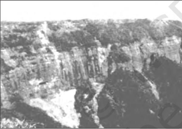
चित्र 2.5 : प्रायद्वीपीय पठार का एक भाग

नदियों के मैदान से 150 मीटर ऊँचाई से ऊपर उठता हुआ प्रायद्वीपीय पठार तिकोने आकार वाला कटा-फटा भूखंड है, जिसकी ऊँचाई 600 से 900 मीटर है। उत्तर पश्चिम में दिल्ली, कटक (अरावली विस्तार), पूर्व में राजमहल पहाड़ियाँ, पश्चिम में गिर पहाड़ियाँ और दक्षिण में इलायची (कार्डामम) पहाड़ियाँ, प्रायद्वीप पठार की सीमाएँ निर्धारित करती हैं। उत्तर-पूर्व में शिलांग तथा