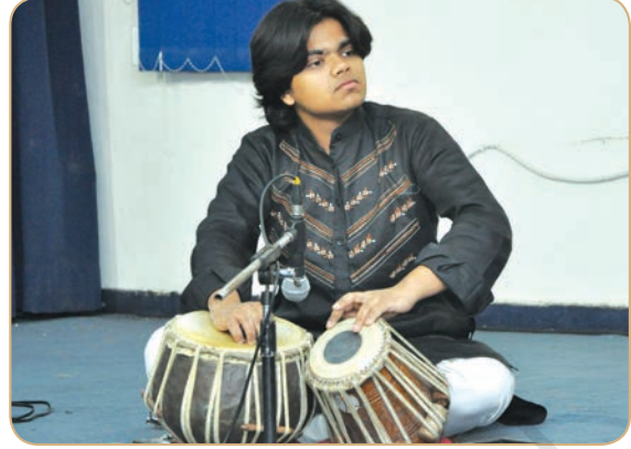
चित्र 2.2—तबला बजाते हुए तबला वादक

इंडरी या गुडरी (रिंग) — यह कपड़े, नारियल की डोरी, मूँज आदि से बनी गोल आकृति की होती है, जिस पर तबला और डग्गा रखकर वादन किया जाता है। इससे तबला वादन करते समय हिलता नहीं है और तबले तथा विशेषतः डग्गे की गूँज भी बढ़ जाती है।