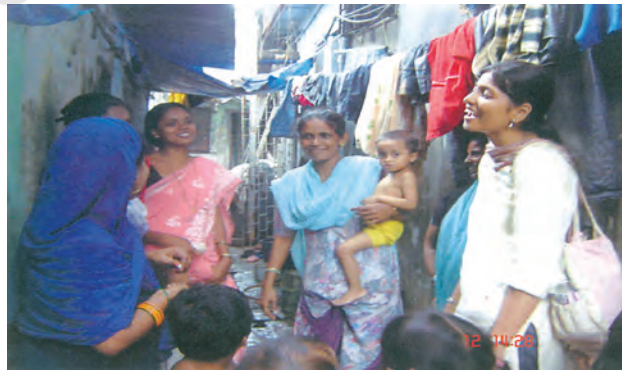
माताओं के साथ परामर्श