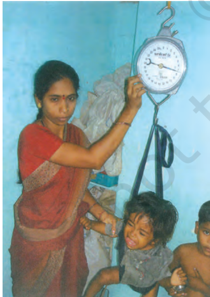
बच्चे का वजन