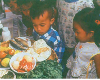
पोषाक आहार उपलब्ध कराना