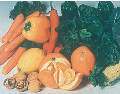
विटामिन A के अच्छे स्रोत हैं। पीले, हरे और नारंगी रंग के फल तथा सब्जियाँ