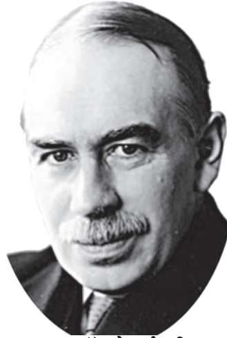
जॉन मेनार्ड कीन्स

ब्रिटिश अर्थशास्त्री जॉन मेनार्ड कीन्स का जन्म 1883 में हुआ था। उनकी शिक्षा किंग्स कॉलेज, कैंब्रिज यूनाइटेड किंगडम में हुई थी और बाद में 'विशेषज्ञ' के रूप में नियुक्त हुए। प्रथम विश्व युद्ध के वर्षों में वे तीक्ष्ण विद्वता के अलावा सक्रिय अंतर्राष्ट्रीय राजनायिक के रूप में भी जुड़े रहे। अपनी पुस्तक 'इकोनॉमिक कंसीक्वेसेज ऑफ द पीस' (1919) में युद्ध की शांति समझौते के भंग होने की भविष्यवाणी इन्होंने कर दी थी। उनकी पुस्तक 'जनरल थ्योरी ऑफ इंफ्लायमेंट, इंटरेस्ट एंड मनी' (1936) बीसवीं सदी की अर्थशास्त्र की महत्वपूर्ण पुस्तकों में से एक है। कीन्स विदेशी मुद्रा के समझदार सट्टेबाज थे।