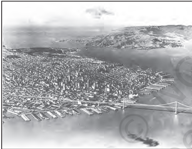
चित्र 8.4 : सैन फ्रांसिस्को, विश्व का सबसे बड़ा स्थलरुद्ध पत्तन

पत्तन जहाज़ के लिए गोदी, लादने, उतारने तथा भंडारण हेतु सुविधाएँ प्रदान करते हैं। इन सुविधाओं को प्रदान करने के उद्देश्य से पत्तन के प्राधिकारी नौगम्य द्वारों का रख-रखाव, रस्सों व बजरों (छोटी अतिरिक्त नौकाएँ) की व्यवस्था करने और श्रम एवं प्रबंधकीय सेवाओं को उपलब्ध कराने की व्यवस्था करते हैं। एक पत्तन के महत्त्व को नौभार के आकार और निपटान किए गए जहाज़ों की संख्या द्वारा निश्चित किया जाता है। एक पत्तन द्वारा निपटाया नौभार, उसके पृष्ठ प्रदेश के विकास के स्तर का सूचक है।