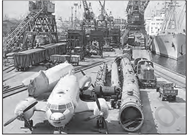
चित्र 8.5 : लेनिनग्राद का वाणिज्यिक पत्तन