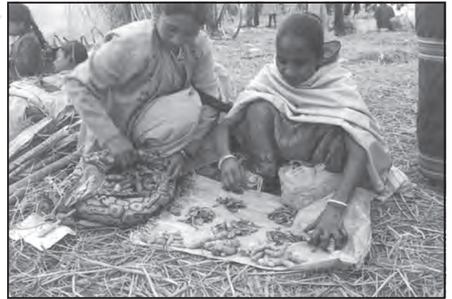
चित्र संख्या 8.1 : जॉन बीलमेला में वस्तुओं का आदान-प्रदान करती दो महिलाएँ

आदिम समाज में व्यापार का आरंभिक स्वरूप 'विनिमय व्यवस्था' था, जिसमें वस्तुओं का प्रत्यक्ष आदान-प्रदान होता था अर्थात् वस्तु के बदले में रुपये के स्थान पर वस्तु दी जाती थी। इस व्यवस्था में यदि आप एक कुम्हार होते और आपको एक नलसाज की आवश्यकता होती, तो आपको एक ऐसा नलसाज ढूँढ़ना पड़ता, जिसे आप द्वारा बनाए हुए बर्तनों की आवश्यकता होती और आप उसकी नलसाज की सेवाओं के बदले अपने बर्तन देकर आदान-प्रदान कर सकते थे।