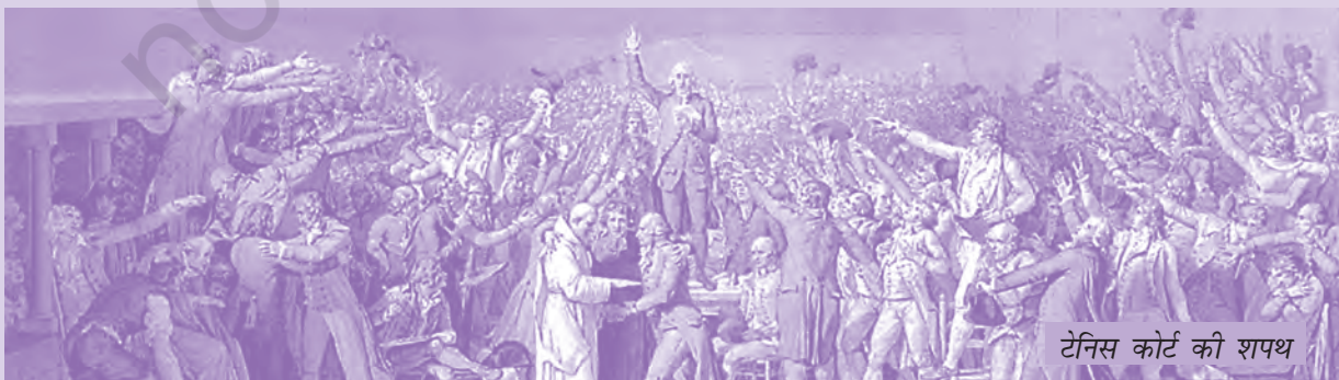
टेनिस कोर्ट की शपथ