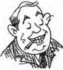
जनाब बिग ऑयल बिग ऑयल एंड संस के सीईओ

एक दिन मैंने खुद से पूछा कि आखिर मैं अपने मुल्क के किस काम आ सकता हूँ। मेरे मुल्क में तेल की भूख विकट है। वह कभी खत्म होने का नाम नहीं लेती, चलो, तो फिर तेल का इंतजाम करते हैं। मैं बाजार की आज़ादी का हामी हूँ। मतलब यह कि दूर के देशों में तेल के कुएँ खोदने की आज़ादी; धरती की आबो-हवा को मटियामेंट करने की आज़ादी और ऐसे कठपुतले तानाशाहों की ताजपोशी की आज़ादी जो अपनी ही जनता पर कोड़े फटकारे।