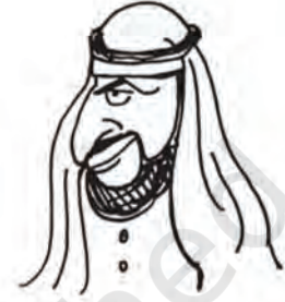
शेख पैट्रो डॉलर-उल्ला काला सोना मुल्क के सुल्तान

वेशकीमती चीजों की मैं कद्र करता हूँ। बिग ऑयल कहते हैं कि उनके राष्ट्रपति आज़ादी और जम्हूरियत को बड़ा कीमती मानते हैं इसीलिए मैंने भी अपने मुल्क में आज़ादी और जम्हूरियत को सात तालों के भीतर बंद करके रखा है।