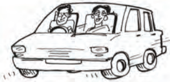
श्री एवं श्रीमती बड़बोले