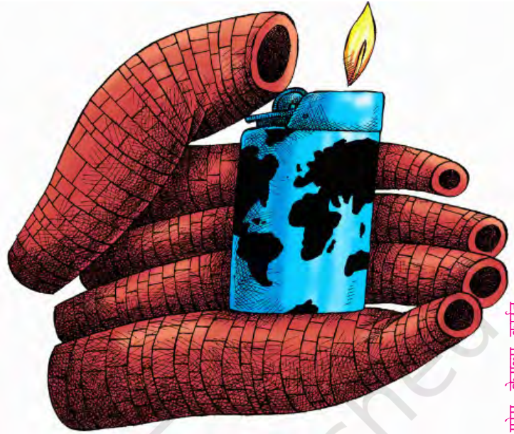
एरस, केगल्स कार्टून

हालाँकि पर्यावरण से जुड़े सरोकारों का लंबा इतिहास है लेकिन आर्थिक विकास के कारण पर्यावरण पर होने वाले असर की चिंता ने 1960 के दशक के बाद से राजनीतिक चरित्र ग्रहण किया। वैश्विक मामलों से सरोकार रखने वाले एक विद्वत् समूह 'क्लब ऑव रोम' ने 1972 में 'लिमिट्स टू ग्रोथ' शीर्षक से एक पुस्तक प्रकाशित की। यह पुस्तक दुनिया की